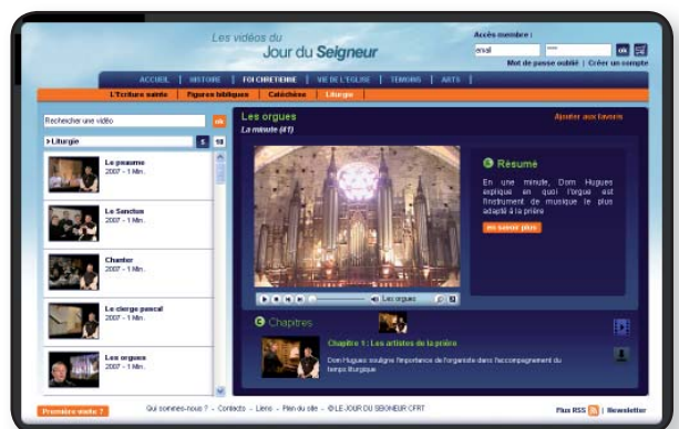
■ SITE INTERNET DE VOD/ÉOD.